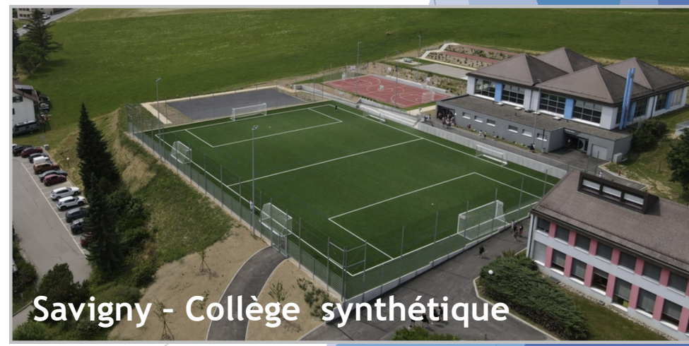
Savigny - Collège synthétique