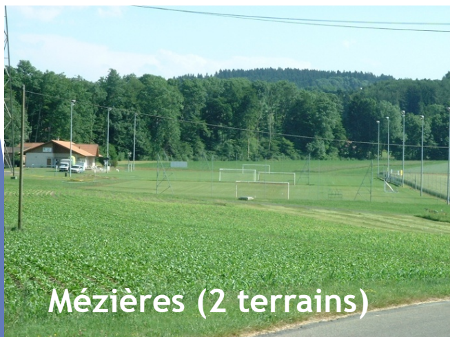
Mézières (2 terrains)