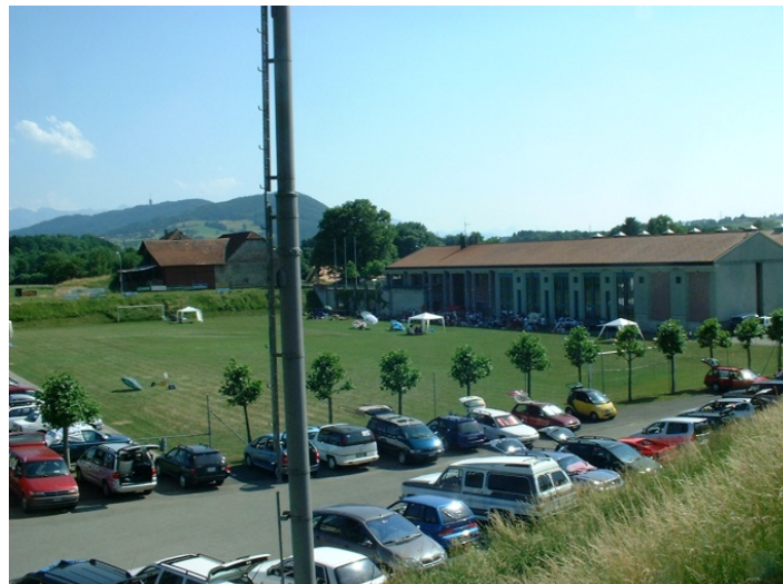
Palézieux - Collège