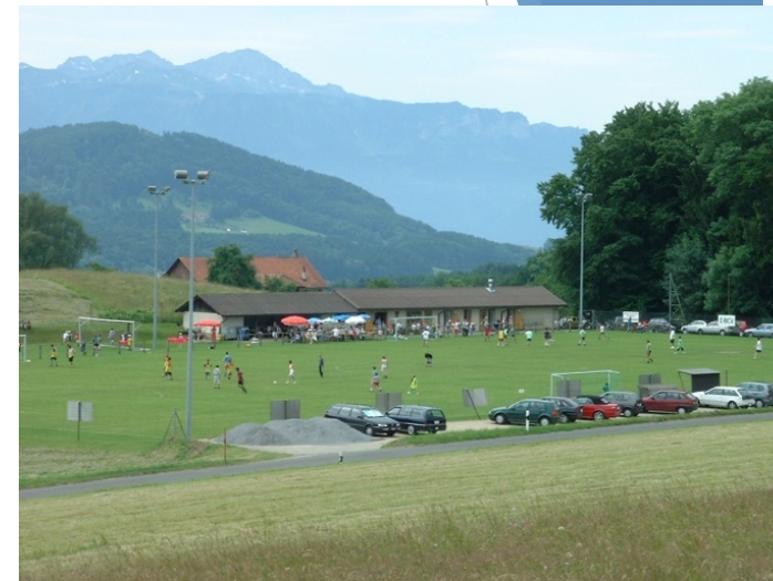
Savigny - St-Amour